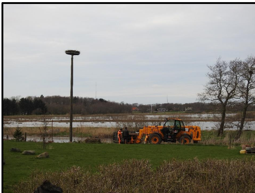
Og her Skærum mølle