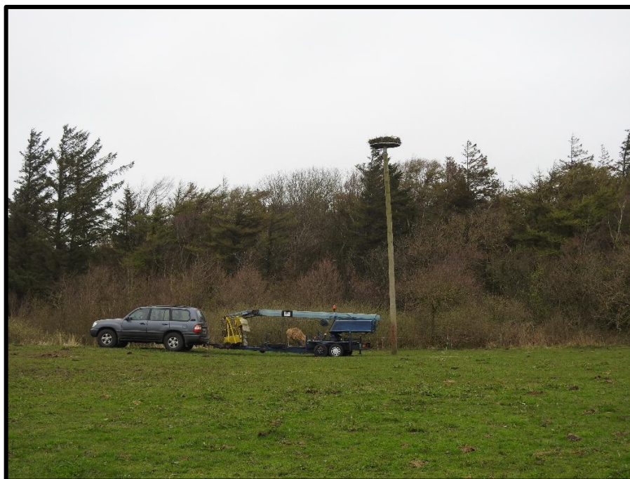
Klar til renovering

12. april fik de 3 reder i Tim også en tiltrængt renovering i form af nye grene, halm og sphagnum!