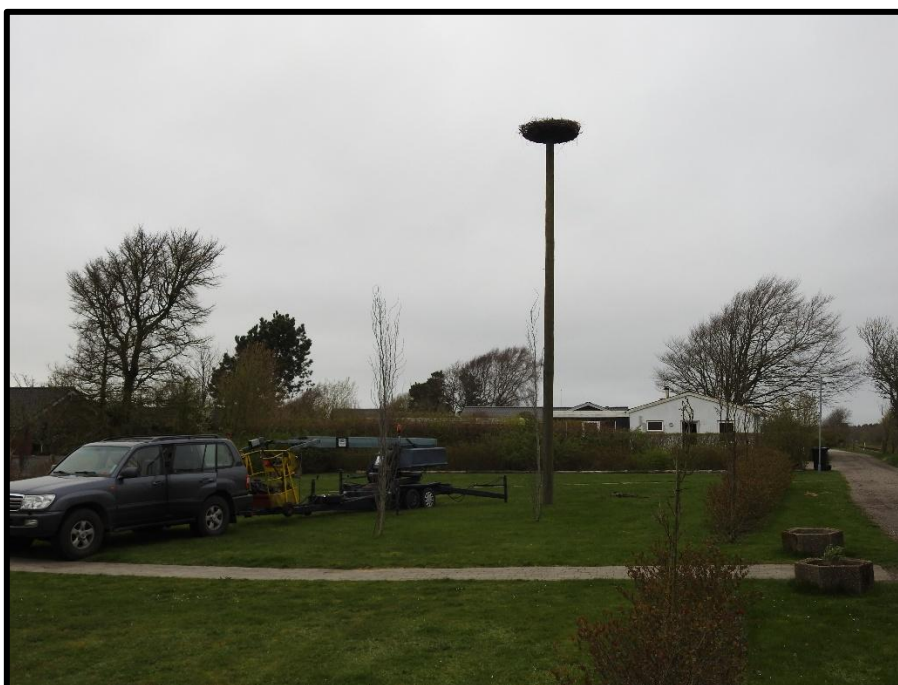
Reden i Tim nær Brugsen