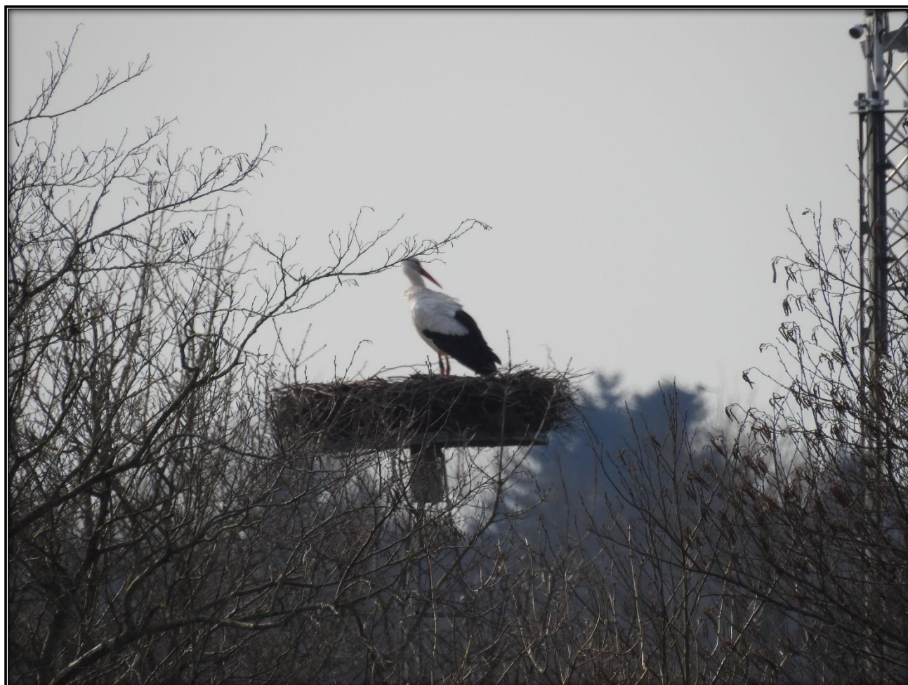
"Kjeld" i Flynder, Bækmarksbro var tilbage på reden 12. marts og dette foto er taget dagen efter.

Hvid Stork er en elsket fugl – i Vestjylland ynglede ingen storkepar i perioden fra 1981 til 2019, hvor et nyt par sensationelt slog sig ned i Flynder ved Bækmarksbro, der var ynglesucces igen i 2020. I 2021 kom hunnen meget sent og der kom ingen æg og unger og det gentog sig i 2022! Storkegruppen blev oprettet for at understøtte rede opsætning og følge Hvid Stork i det vestjyske og forhåbentlig kan vores indsats være med til at vi får flere ynglepar i vores landsdel igen.