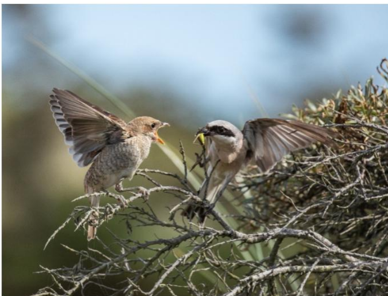
Rødrygget tornskade afleverer græshoppe til udløjet unge.

DOF BirdLife inviterer alle medlemmer til at deltage i en ny fotokonkurrence med temaet ”Insektædende fugle i aktion” – og der er flotte præmier på spil.