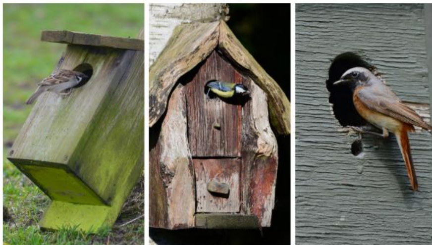
Forskellige variationer af redekasser til havens fugle. Fra venstre: Skovspurv, Musvit og Rødstjert.

Fuglesangen lyder allerede så småt derude, og i løbet af de kommende uger vil blåmejsler, musvitter, skovspurve og stære begynde at kigge på mulige adresser til deres kommende familieliv. Senere i april og maj vil trækfugle som rødstjerte og fluesnappere indfinde sig efter en lang vinterferie i troperne, og de går straks på udkig efter en bolig.