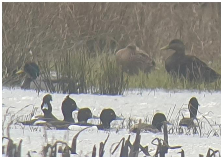
Ny art for Danmark. Sortbrun And. Skjern Enge 18/3-2024.