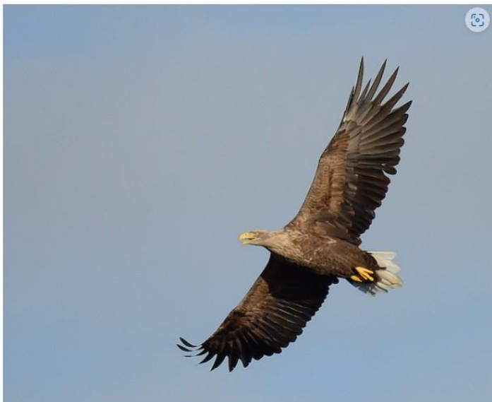
Voksen havørn i flugt.

Tag børnene i den ene hånd og kikkerten i den anden, når DOF BirdLife inviterer dig og din familie ud i det danske vinterlandskab, for at opleve vores majestætiske ørne d. 25. februar 2024.