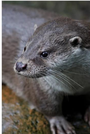
Odderen – en succeshistorie i dansk naturforvaltning

” Fra at være på randen af udryddelse i begyndelsen af 1980`erne er odderbestanden i Danmark nu igen udbredt i det meste af landet. Odderens positive bestandsudvikling bliver i dag betegnet som en succeshistorie i dansk naturforvaltning. Foredraget vil sammenfatte den nyeste viden om odderens biologi, udbredelse, de nødvendige samarbejdsrelationer, hvordan man finder spor efter oddere, samt de forvaltningsmæssige tiltag der blev taget i anvendelse.