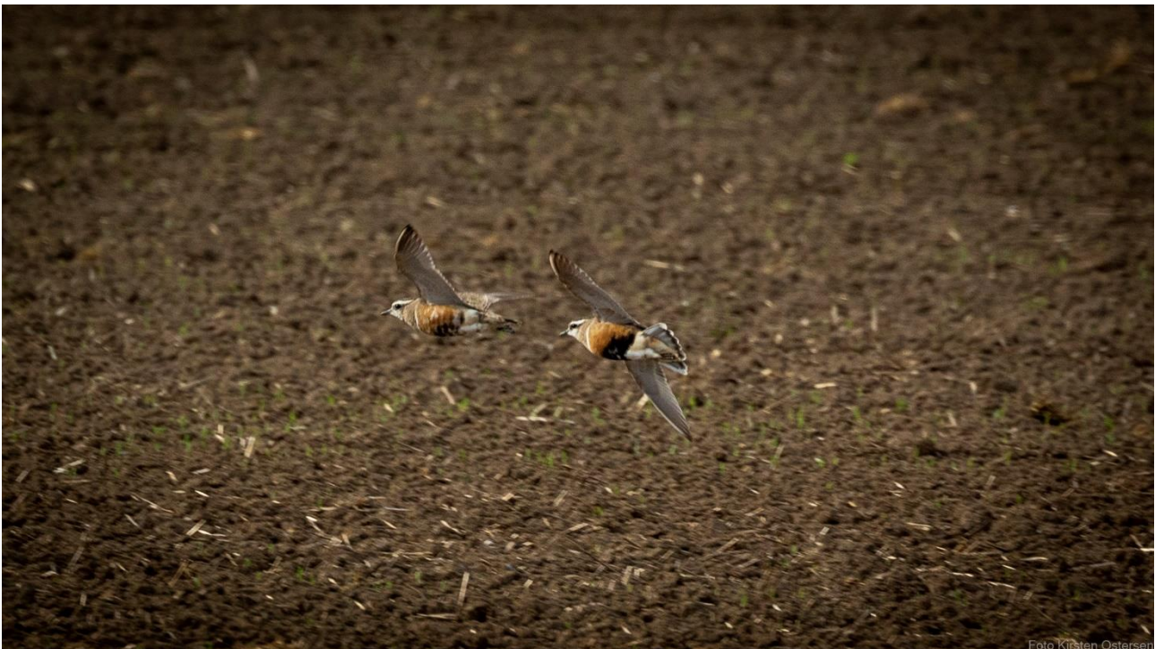
Pomeransfugle - Skjern enge

Er du enig i vores bekymring er den bedste måde at tilkendegive dette, at deltage i en lokal underskriftsindsamling ”Nej, tak til vindmøller i Skjern enge” .