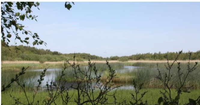
Stoubæk Krat - mossen.