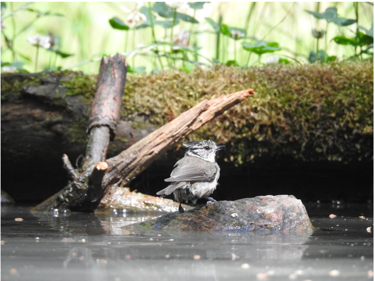
Foto fra Fugleværnsfondens fantastiske spejlbasin ved Stubbe sø

DOF Vestjylland Dansk Ornitologisk Forening