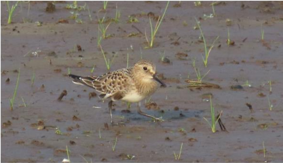
Bairdsryle, Værnengene 11/9-2023.