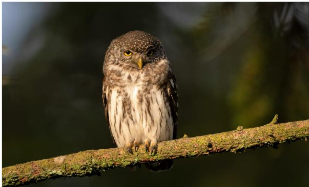
Spurveuglen er indtil ynglefundet i Midtjylland kun set uregelmæssigt i Danmark.

Vi har hen over sommeren haft flere SU-arter og også andre interessante fund :-)