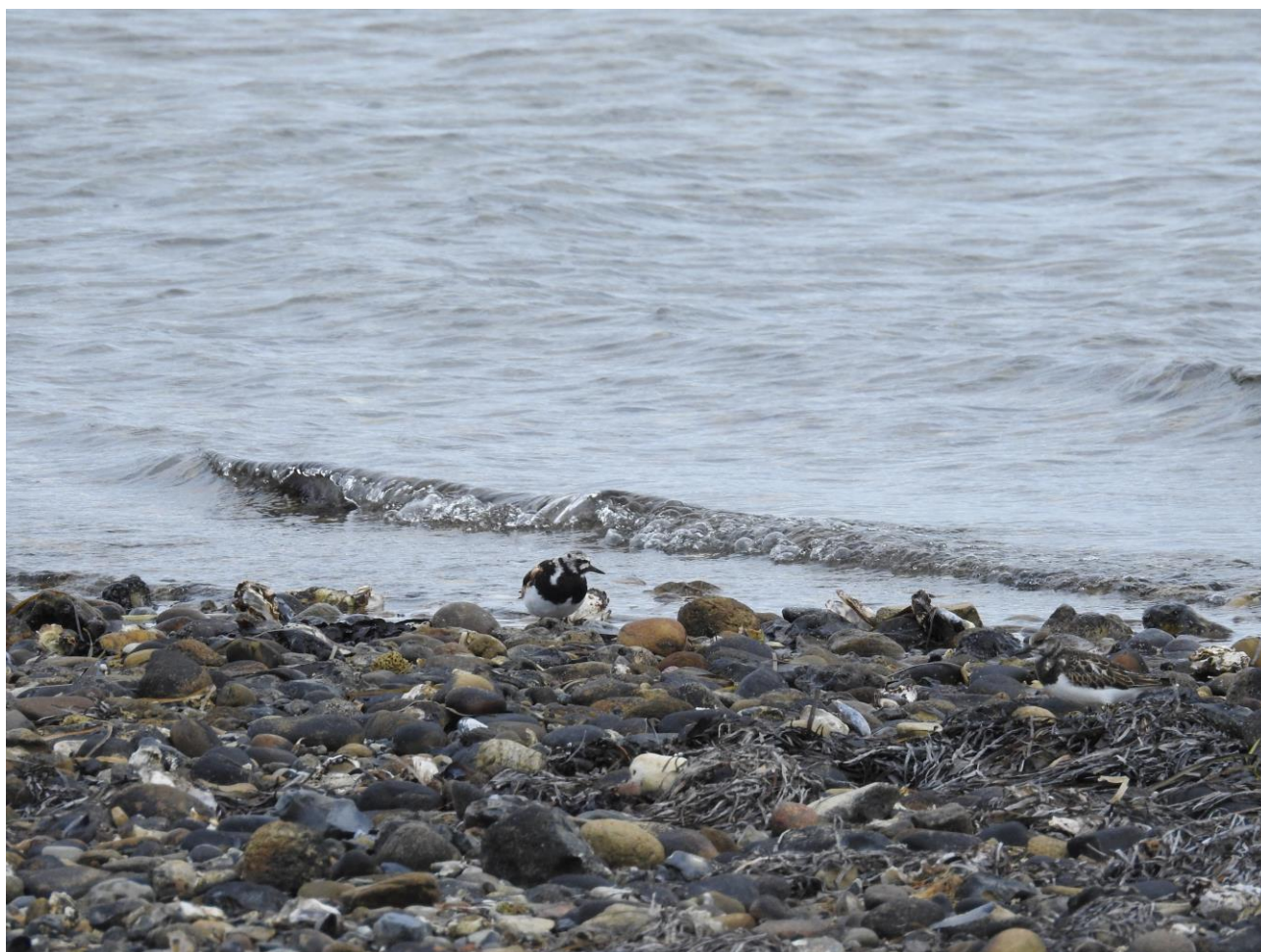
2 Stenvendere på Jegind Tap, som er sydligste spids af Jegindø – 26.8.2023