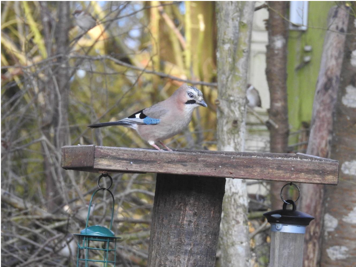
Skovskade – den har 11 af 23 deltager haft på matriklen i 2023 indtil nu!

Der er netop oplagt en artikel på hjemmesiden " Boligbirding – foråret nærmer sig " med den aktuelle stilling, samt facts lokalt og fra hele landet, da det er en konkurrence, som DOFs lokalafdelinger står for!