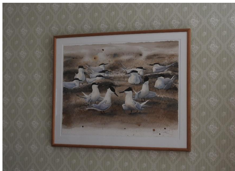
Her et af motiverne i stuerne på Nr.Vosborg ifbm. Jubilæumsudstillingen