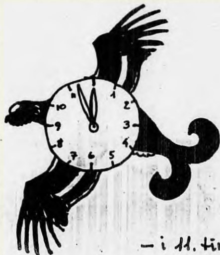
Illustration: Sv. Erik Petersen

Redaktion: Jens Ballegård Erik Enevoldsen